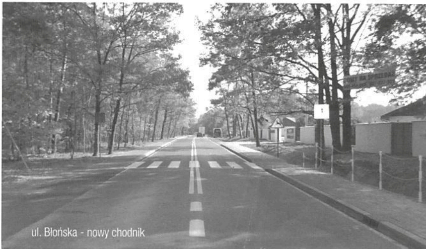
ul. Błońska - nowy chodnik

OSP Młochów), Szamotach (przy pętli autobusowej), Strzeniówce (ul. Komorowska), Ruścu (przy znajdującym się w bezpośrednim sąsiedztwie nowej Szkoły Podstawowej Orliku), Woli Krakowiańskiej (przy Szkole Podstawowej), Kostowcu (przy Orliku). W Starej Wsi oprócz siłowni powstał także plac zabaw dla najmłodszych (wydatkowano - 102.099,75 zł ). Koszt realizacji tych inwestycji wyniósł w sumie 206.984,40 zł . Dzięki szybkiemu i sprawnemu zakończeniu tego zadania i sprzyjającej aurze wszystkie ww. miejsca są chętnie i licznie odwiedzane przez mieszkańców.